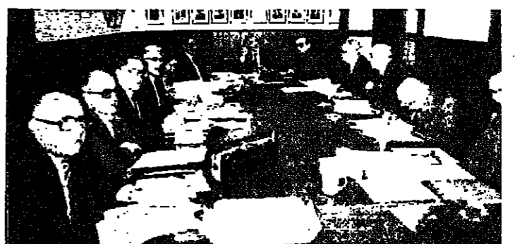
لجنة الإصلاح الدستوري اجتماع برئاسة حيدر

انتهت لجنة الإصلاح الدستوري من اقرار كل المواد الداخلية في الباب الاول من الاحكام الاساسية للدستور الجديد. ونفت ان تكون هناك اية خلافات في وجهات النظر بين الاعضاء حول دستورية النصوص.